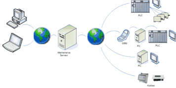
Fonctions et service de Télémaintenance pour Automates et Supervision